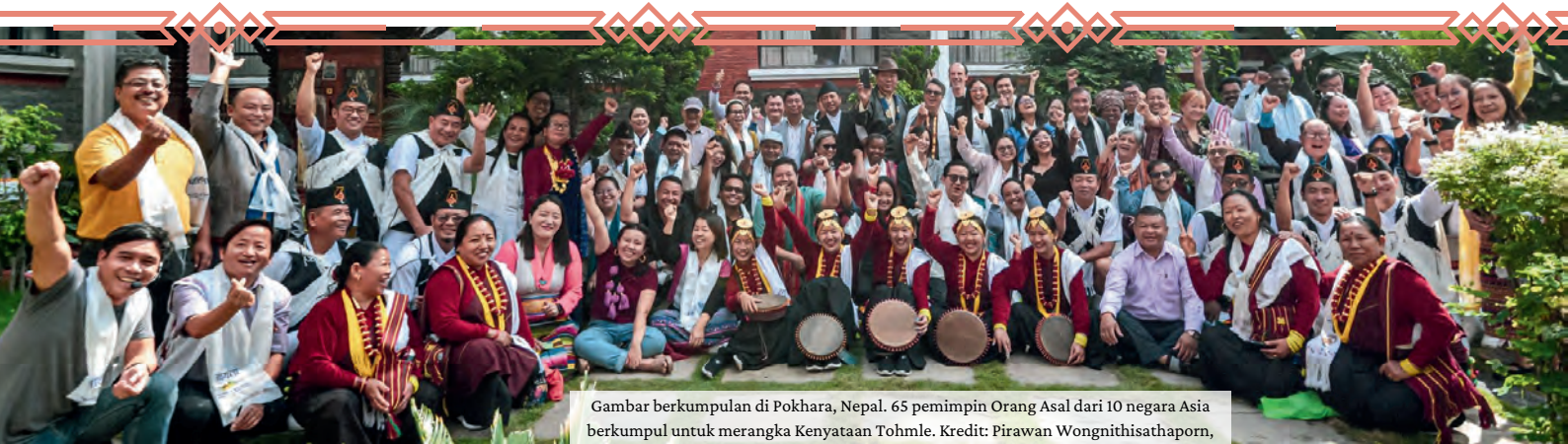
Gambar berkumpulan di Pokhara, Nepal. 65 pemimpin Orang Asal dari 10 negara Asia berkumpul untuk merangka Kenyataan Tohmle.

Daytoy nga pablaak ket napadur-as iti maika-uppat (4th) a kumperensya ti nainsigudan a kaammuan ken tattao iti Asya wenno ti Indigenous Knowledge and Peoples of Asia (IKPA). Ti kumperensya iti Nainsigudan a karbengan ti tattao, ti biodibersidad ken ti panagbalbaliw ti klima a naisayangkat manipud iti umuna nga aldaw ti Oktubre inggana maika-uppat(4th) nga aldaw idia Pokhara, Nepal.