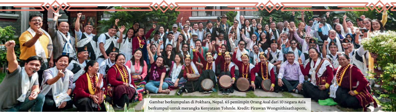
Gambar berkumpulan di Pokhara, Nepal. 65 pemimpin Orang Asal dari 10 negara Asia berkumpul untuk merangka Kenyataan Tohmle.

Taarifa hii ilitengenezwa katika kongamano wa nne wa Indigenous Knowledge and Peoples of Asia (IKPA) wa Haki za Watu wa Asili, Bayoanuwai, na Mabadiliko ya Tabianchi, iliyofanyika Oktoba 1-4, 2024, huko Pokhara, Nepal