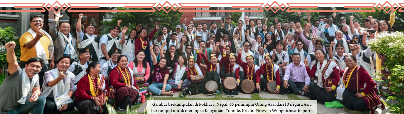
Gambar berkumpul di Pokhara, Nepal. 65 pemimpin Orang Asal dari 10 negara Asia berkumpul untuk merangka Kenyataan Tohmlé.

Kenyataan ini telah dibangunkan di Persidangan Indigenous Knowledge and Peoples of Asia (IKPA) mengenai Hak Orang Asal, Biodiversiti, dan Perubahan Iklim ke-4 yang diadakan dari 1-4 Oktober 2024, di Pokhara, Nepal